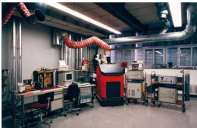
Prüfstand für Holzheizkessel.

Speicher: Stückholzkessel erfordern in jedem Fall einen Energiespeicher, um die Heizwärme bedarfsgerecht dem Haus zuführen zu können. Da Speicher Wärmeverluste aufweisen, ist es ideal, den Speicher innerhalb des beheizten Bereichs zu platzieren.